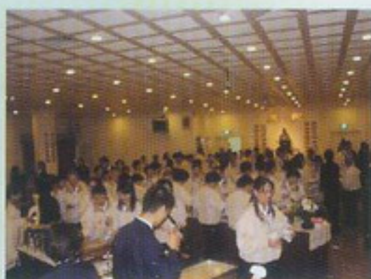
新加坡寶光建德天國佛堂用餐