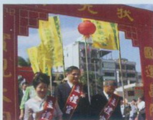
主禮官帶領小狀元過狀元橋