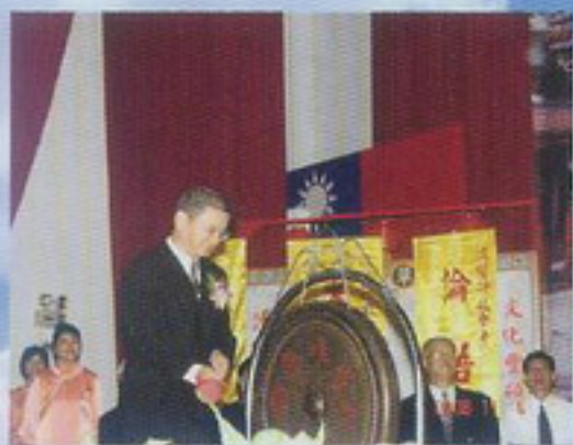
一貫道桃園縣支會詹理事長敲響狀元鑼