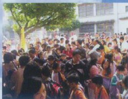
考生報到處，人山人海，盛況空前！