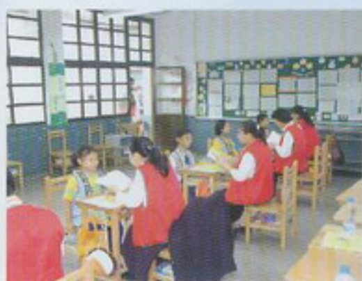
小狀元們參與會考情形