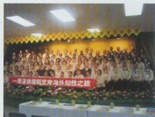
新加坡寶光建德天國佛堂合影留念