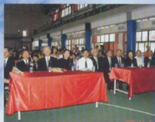
一貫道桃園縣支會理監事們參與盛會