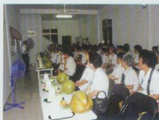
印尼巴淡島基礎忠恕天庸佛堂