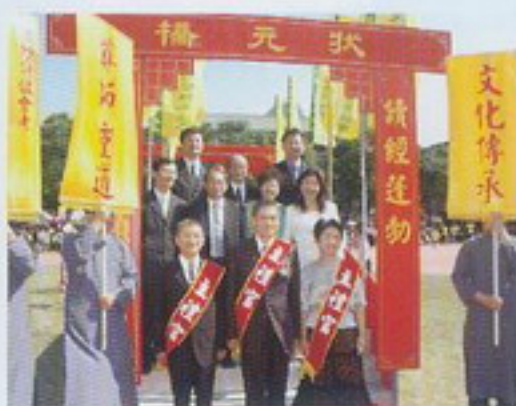
禮官與貴賓狀元橋前合影