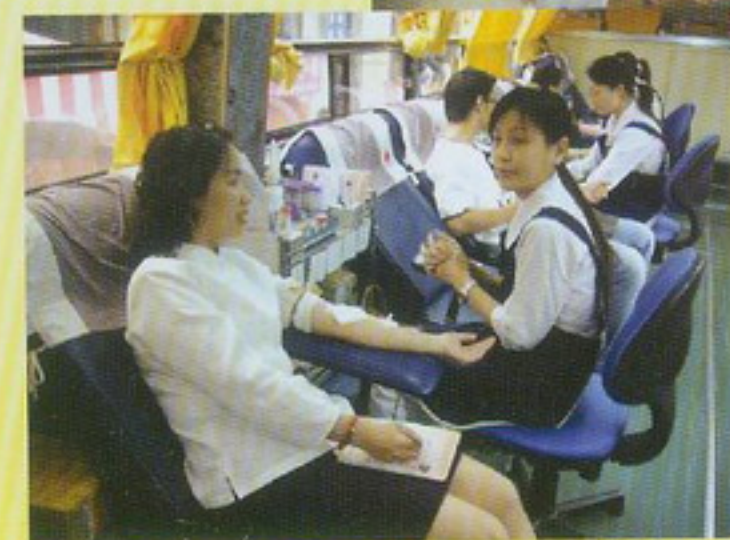
縣支會寶光建德志工上車捐血