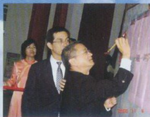
縣支會詹理事長舉行點榜