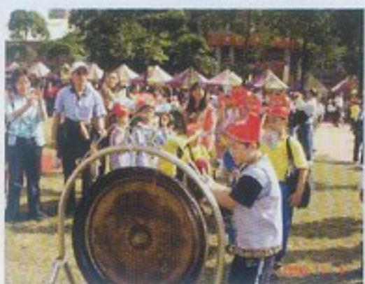
小狀元敲響狀元鑼!