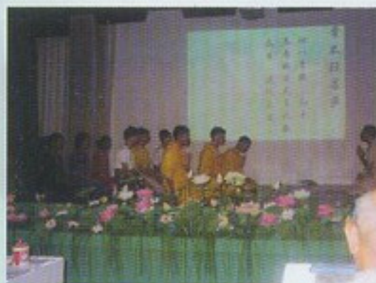
新加坡天國佛堂話劇演出