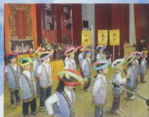
小小讀經團體比賽