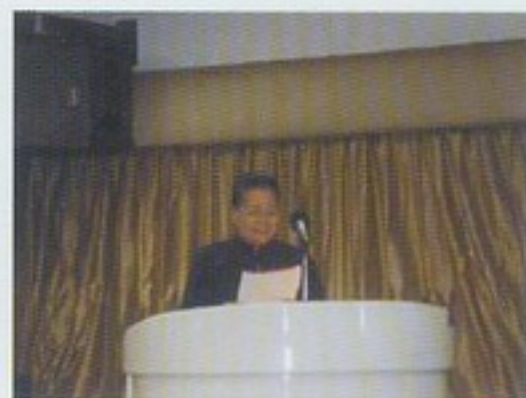
新加坡天國佛堂施點傳師致歡迎詞