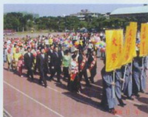
引贊儀隊帶領眾貴賓、小狀元們遊洋