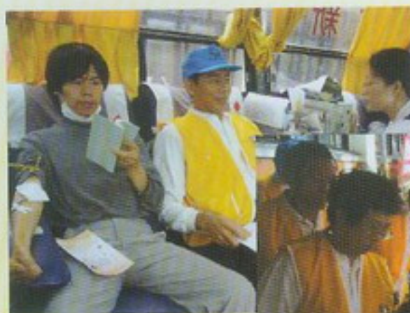
▲縣支會寶光紹興志工上車踴躍捐血