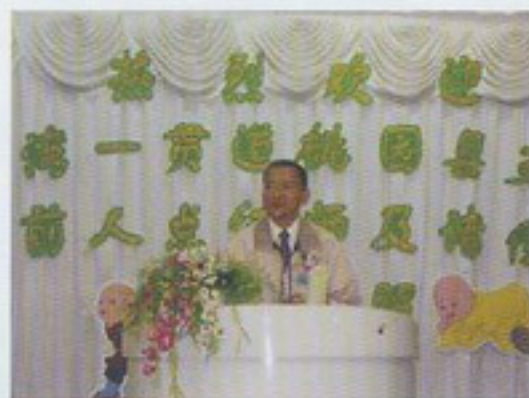
縣支會詹理事長致詞

時間過得很快，為期7天的行程即將告一段落了，此趟新馬知性之旅真是不虛此行，讓我們過得既充實又快樂，也讓全體人員大開了眼界，見到各組線的道務是如此的宏展，入了寶山我們不會空手而回，新馬前賢的修辦經驗讓我們受益良多，南洋之旅異國情深這裏的道親前賢們個個都是和藹可親，笑容可掬，接受他們熱情接待，真是賓至如歸，更讓小後學們感受到天恩師德的浩大，此次新馬回來之後，我們都要更精進、更積極來修辦以報答天恩師德於萬一，方不辜負桃園縣支會辦了這次極具意義的活動。